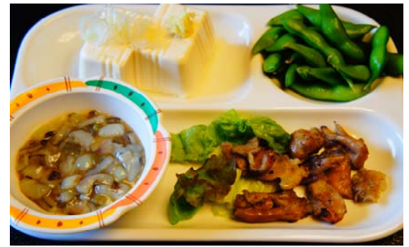
おつまみ4点セット