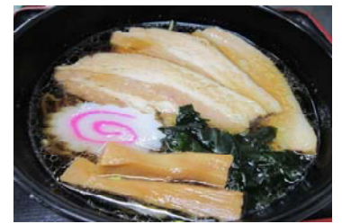
チャーシューメン