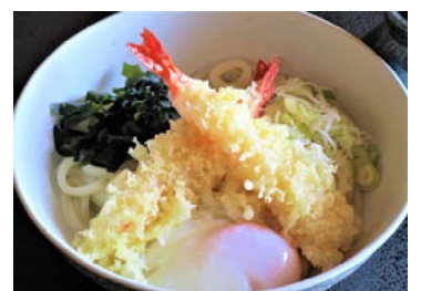
温玉・海老天うどん