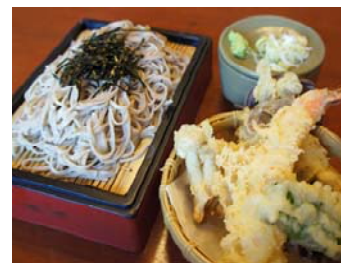
天ざるそば・うどん